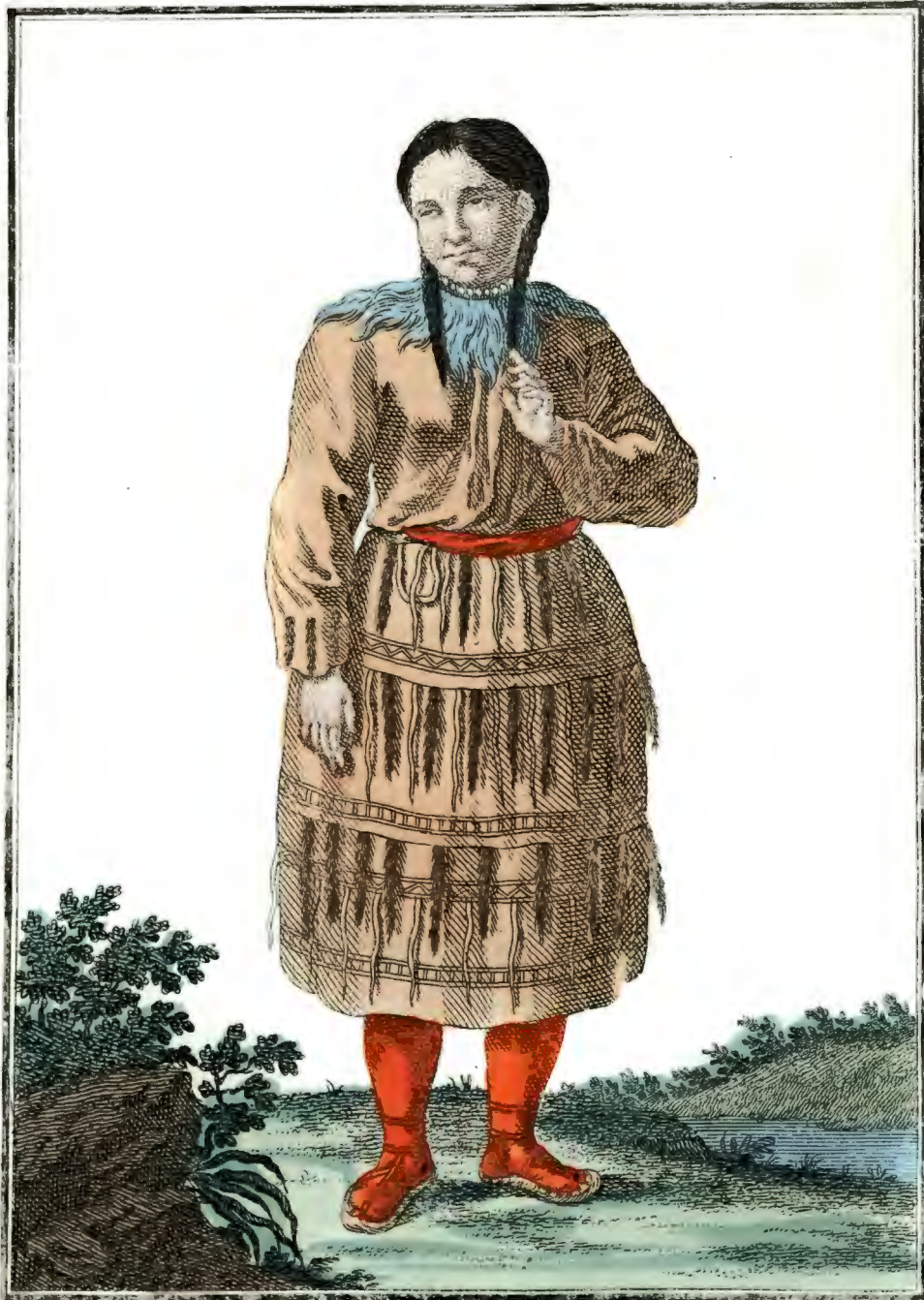
Камчадалка въ великолѣпнѣмъ уборѣ. Eine Kamtschadalin im größten Schmuck. Une Kamtschadale dans sa plus grande parure.