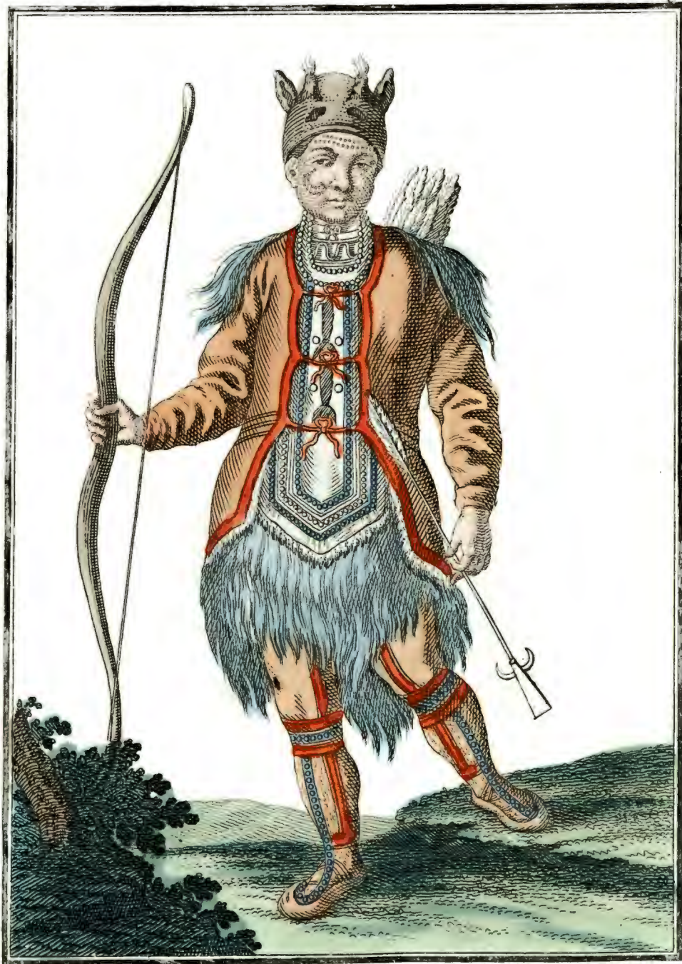
Алунгузъ. En Tungus. Un Toungouse.