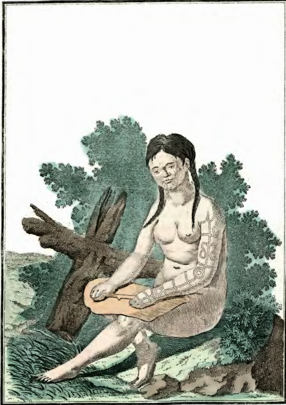
Чукотская баба кожѣ выдѣлывающая. Eine Tschuktächin das Leder zubereitend. Femme Tschouktchienne façonnant des peaux.