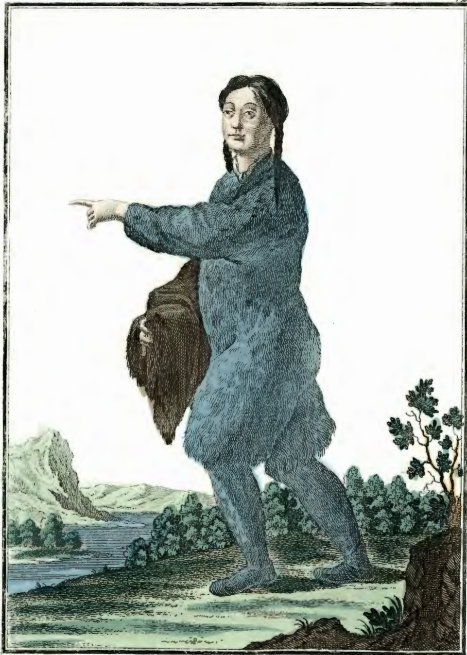
Чукотская баба въ обыкновеннаѣ одеждѣ. Eine Tschuktschin angekleidet. Femme Tchouktchiëne en son habit ordinaire.