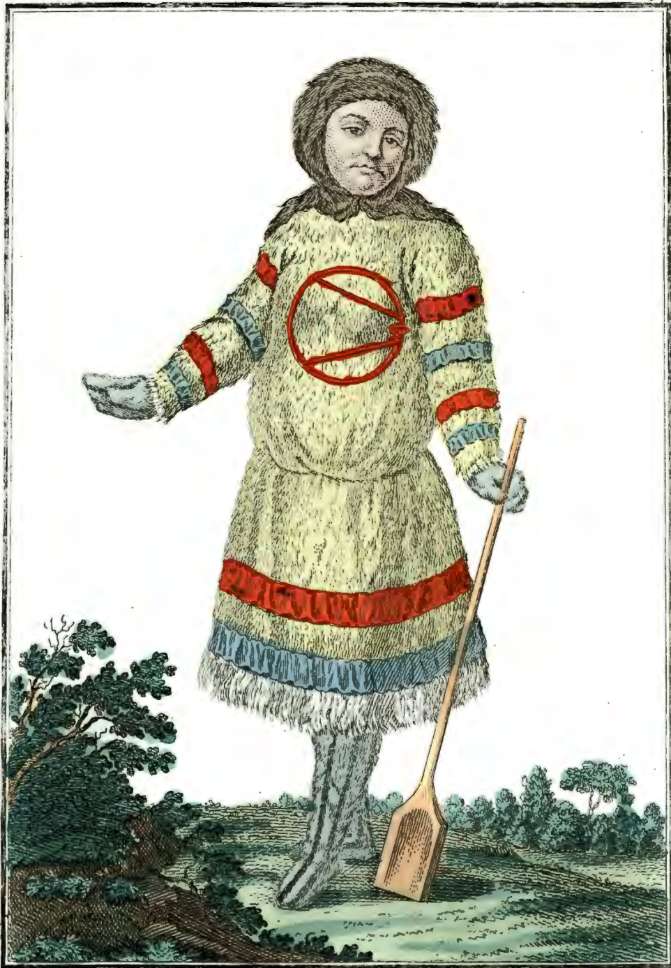
Самоядка спереди. Eine Samojedin vorwärts Femme Samojede par devant.