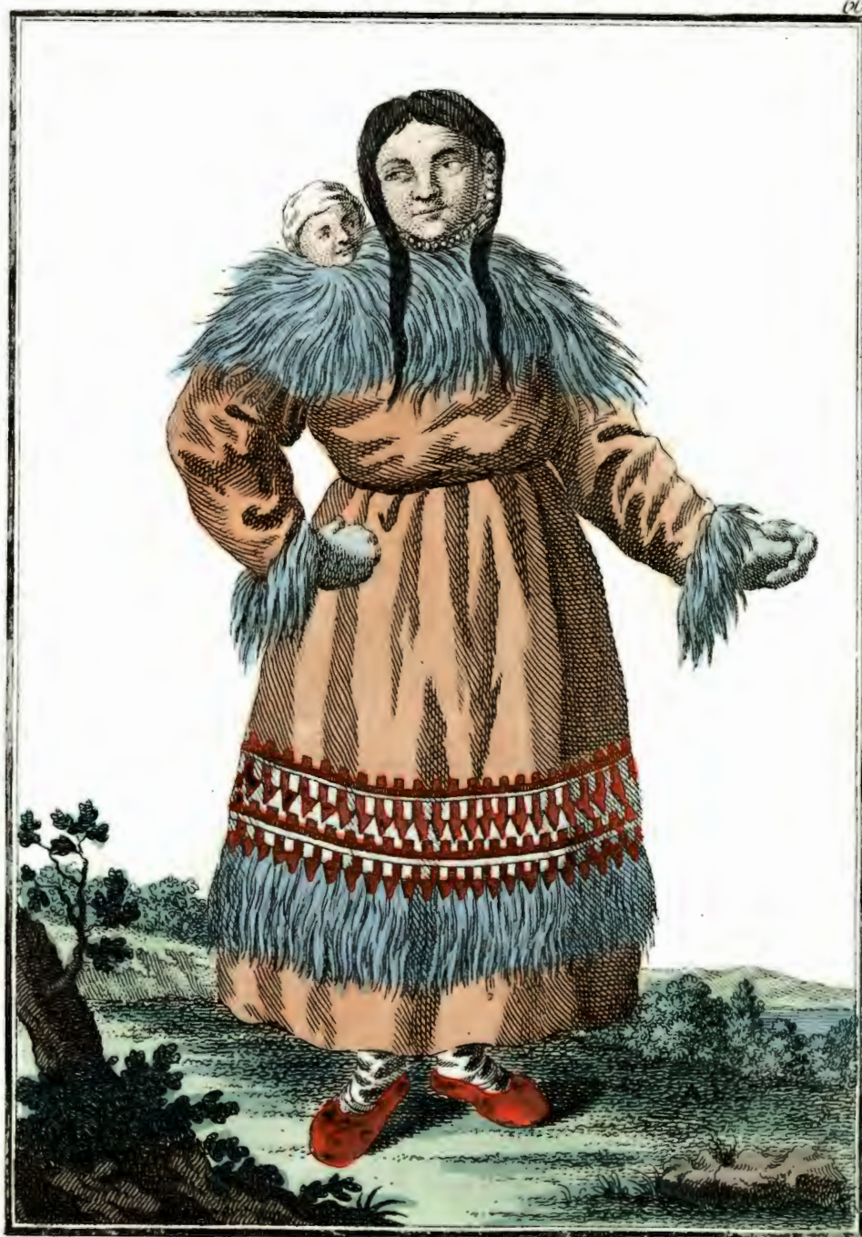
Камчадалка въ хорошемъ платьѣ. Eine Kamtschadalische Frau zierlich gekleidet. Une Kamtschadale en habit de fête.