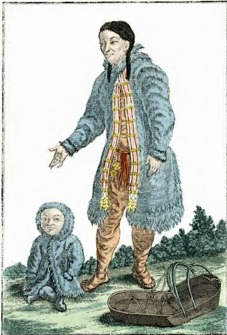
Самоедка въ лѣтнемъ платьѣ. Eine Samojedin im Sommer-Kleid. Femme Samojede en habit d'été.