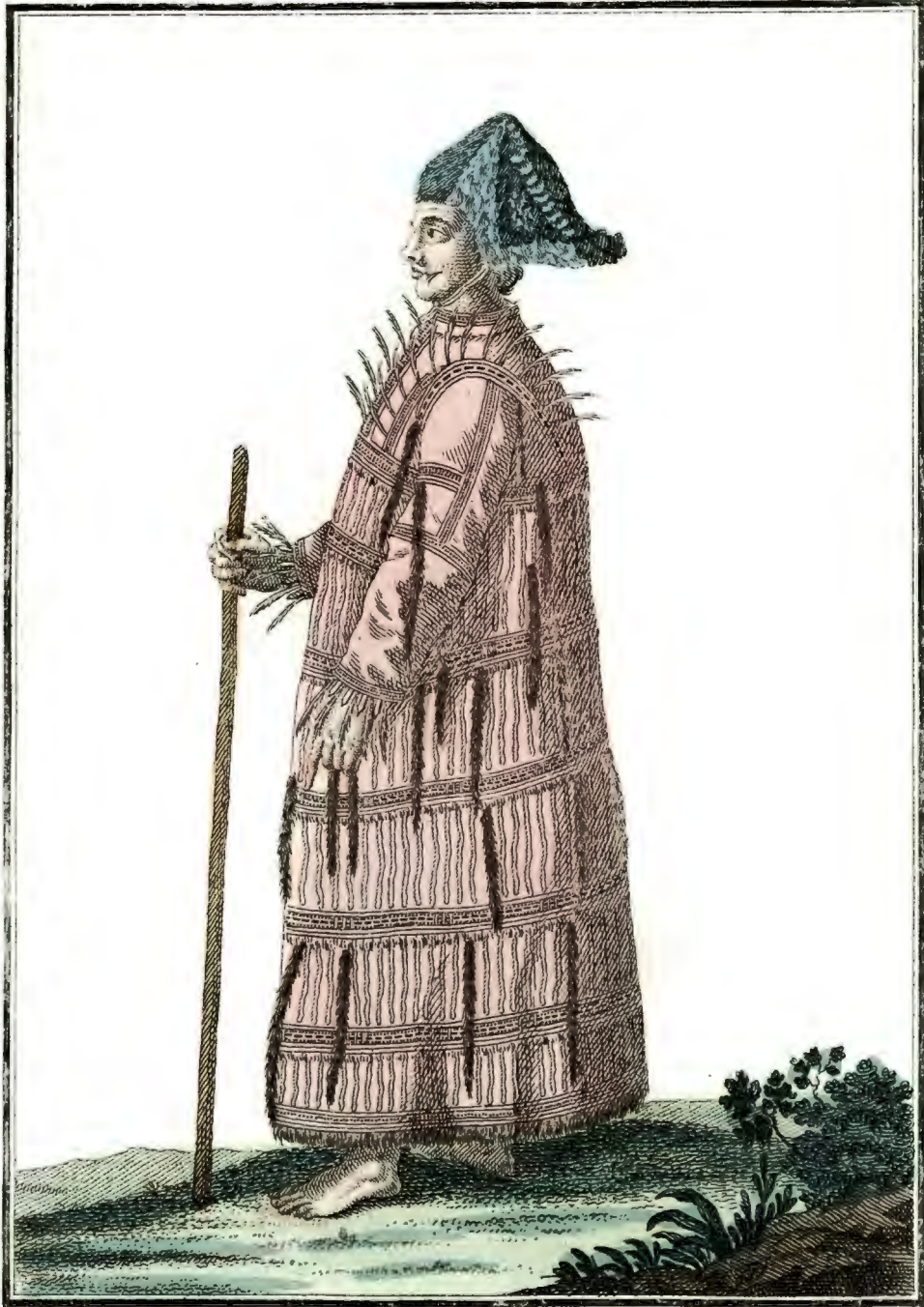
Алутѣ. Ein Alute. Alütien.