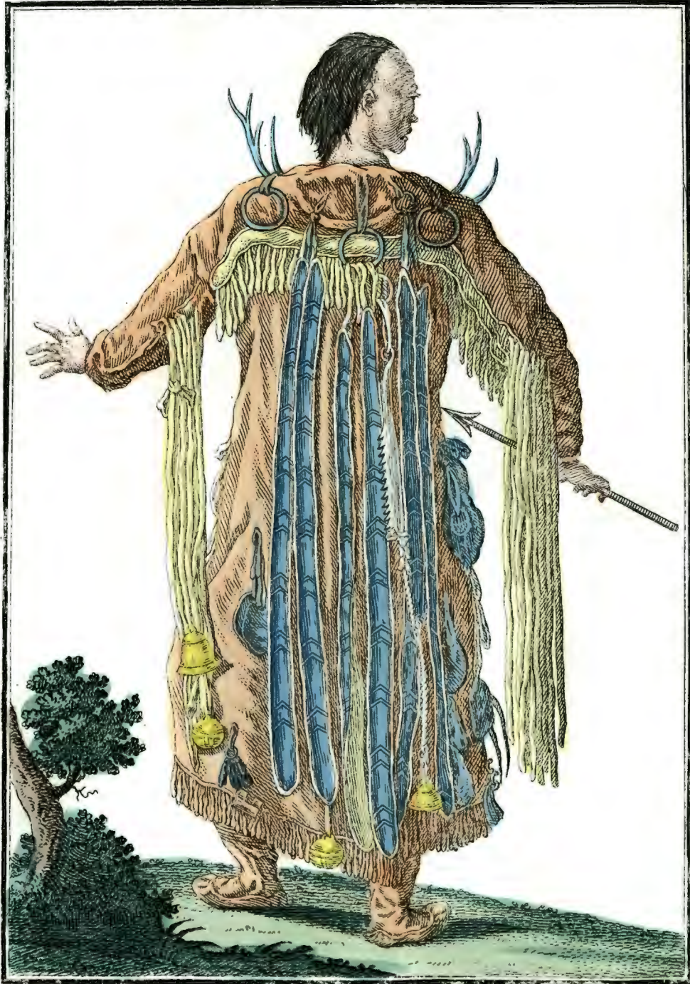
Тунгусской Шаманъ при рѣкѣ Аргунѣ сзади. Ein Tungusischer Schaman am Argun Fluss rückwärts. Devin toungeuse auprès de l'Argoun par derrière.