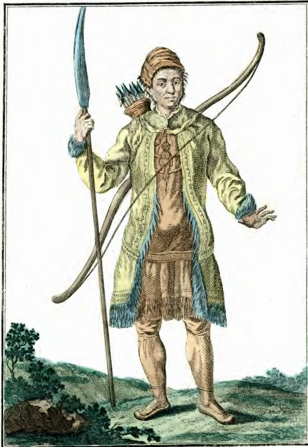
Тунгусъ на охотѣ. Ein Tungus im Jagd-Kleid. Un Tougouse en habit de chasse.