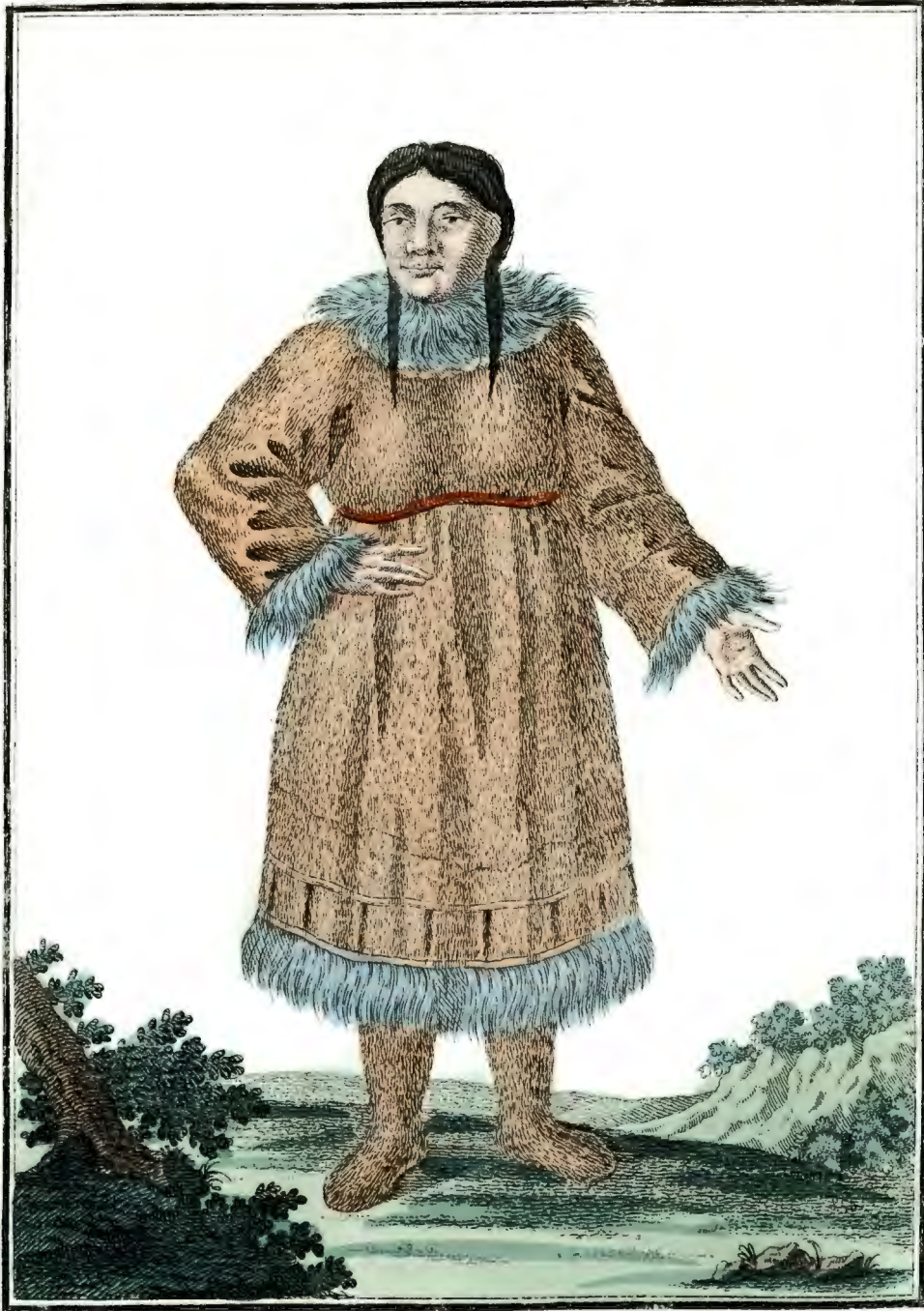
Камчадалка въ простомъ платьѣ. Eine Kamtschadalische Frau in gewöhnlicher Kleidung. Une Kamtschadale en habit ordinaire.