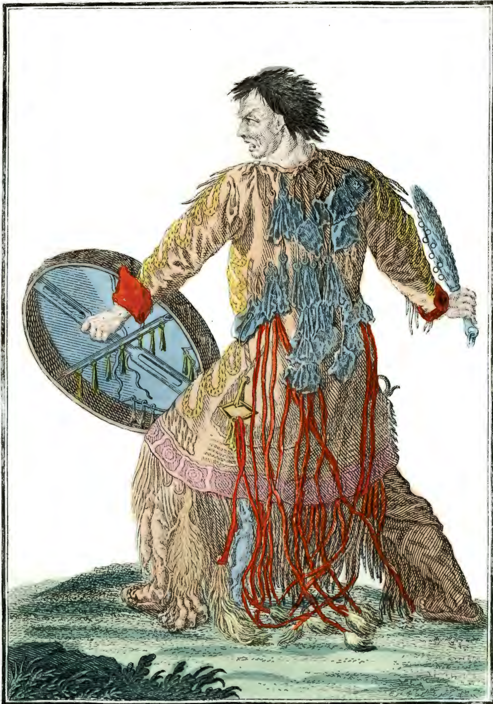
Шаманъ Камчатской. Ein Schamann in Kamtschatka. Dèvin de Kamtchatka.