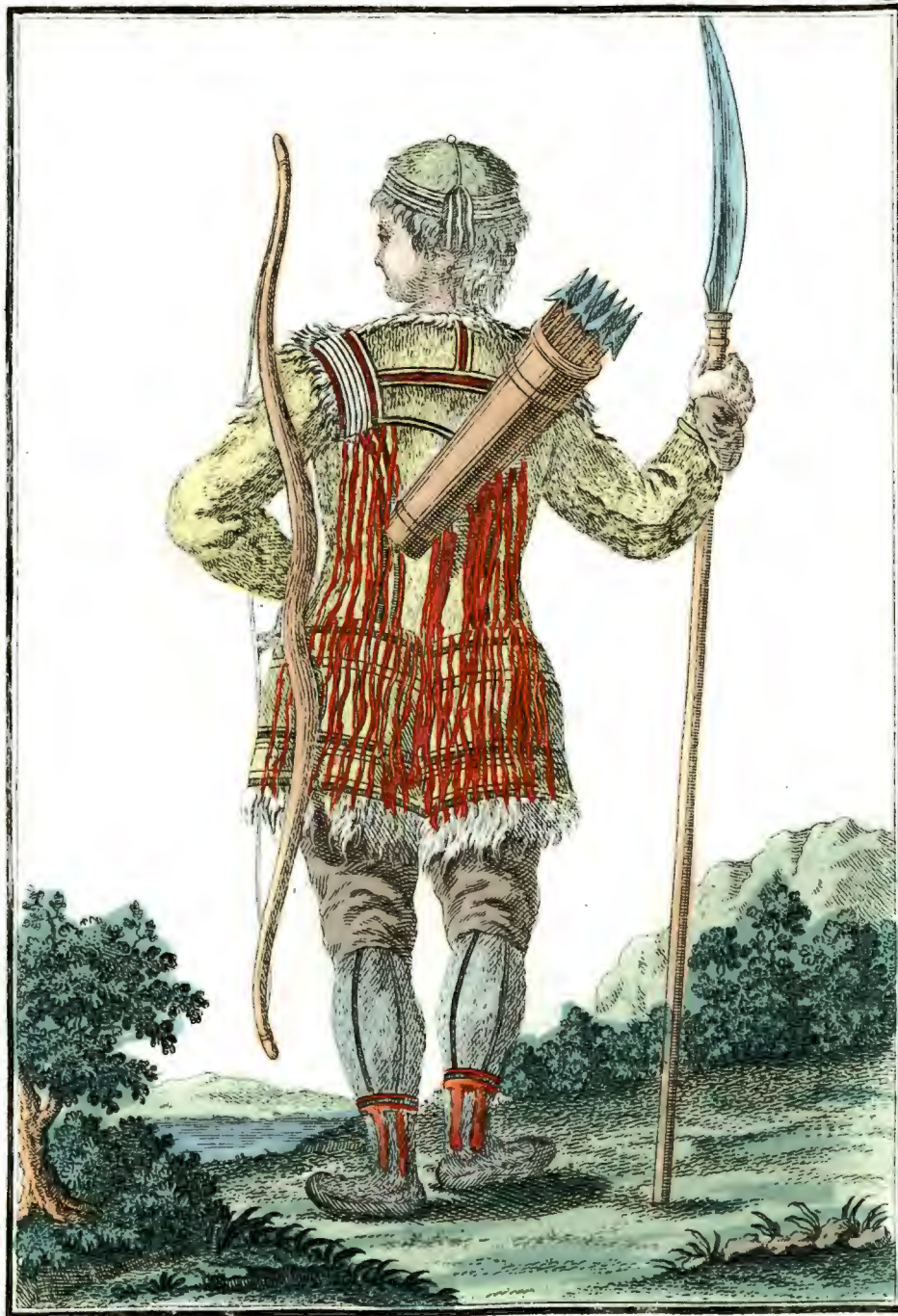
Тунгузъ въ охотничьемъ платьѣ съ тыла. Ein Tungus im Jagd Kleid rückwärts. Un Tungouse en habit de chasse par derrière.