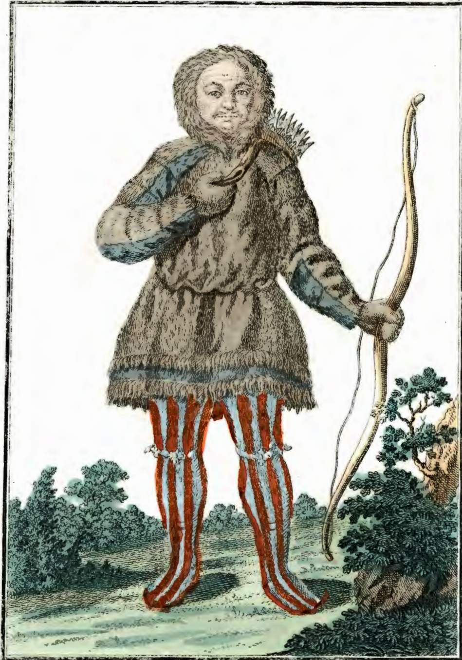
Самоедт. Ein Samojede Vn Sambiede