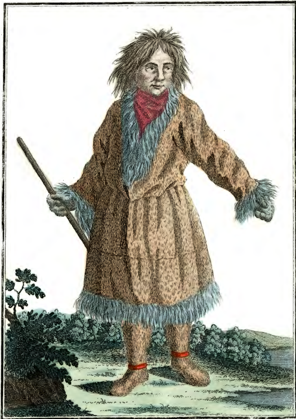
Камшадаль въ зимнемъ платьѣ. Ein Kamtschadal im Winter-Kleide. Un Kamtschadale en habit d'hiver.