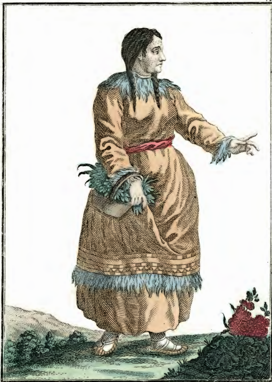
Корытка. Eine Koräkin. Une Koräkienne.