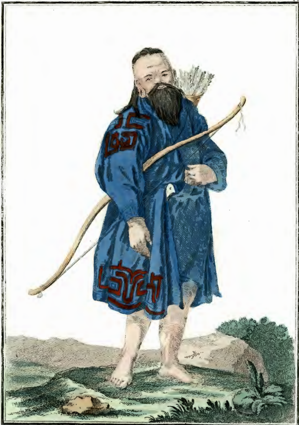
Курилецъ. Ein Kurill. Kourilien.