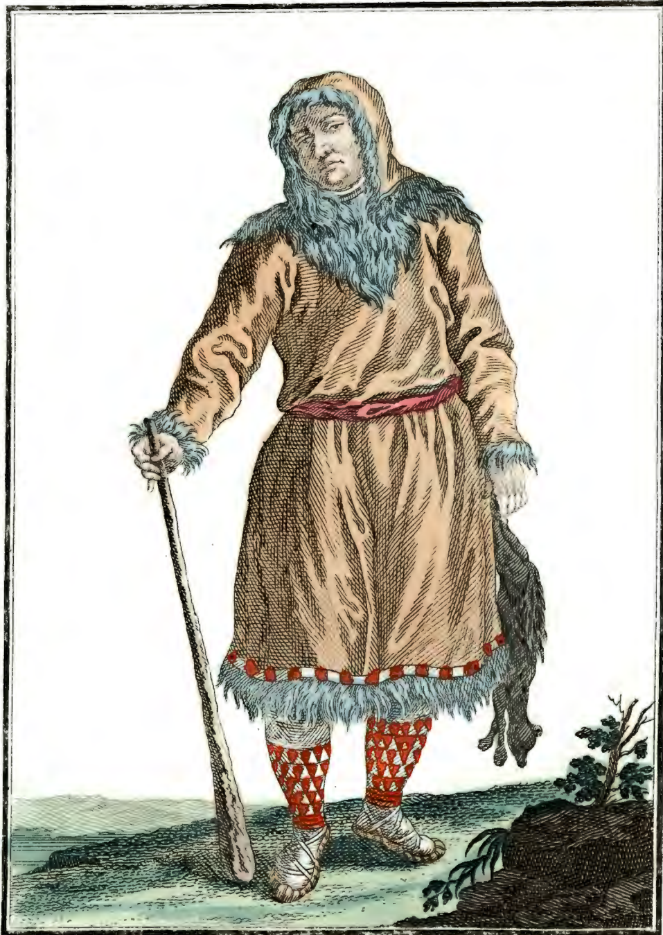
Коракъ. Ein Koräke. Korik.